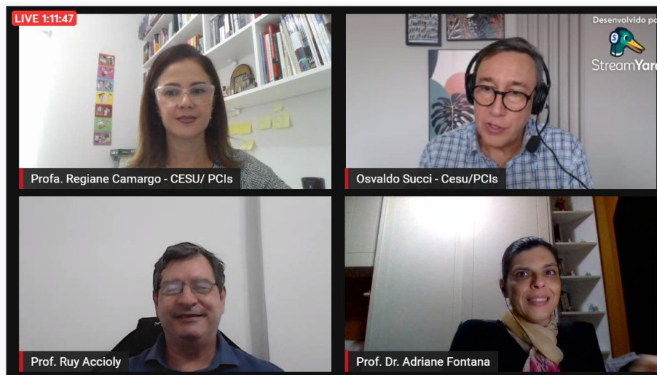
Painel “Gestão da Internacionalização em Casa”