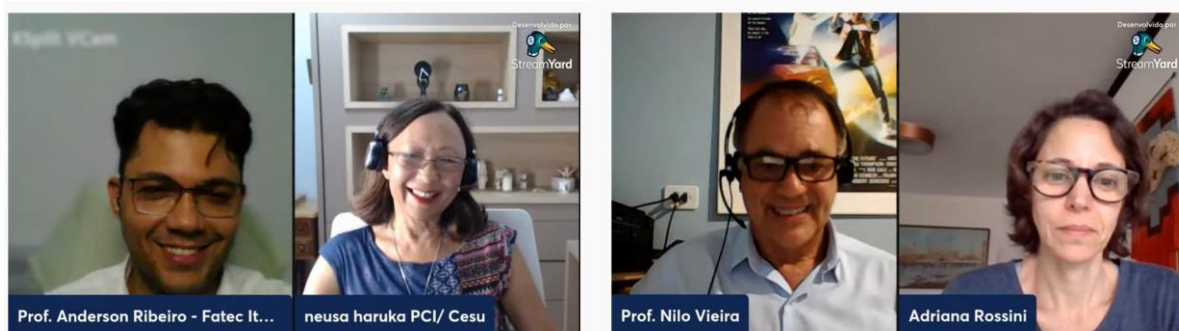
10 SPAP: Introdução aos Projetos Colaborativos Internacionais