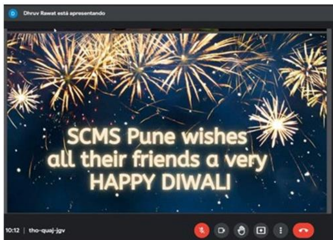
Estudantes indianos apresentam o Diwali, festival hindu